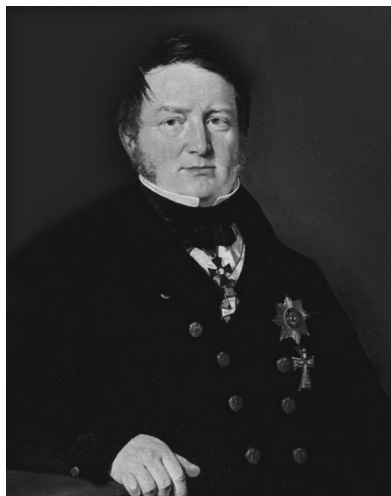
Рис. 6. Парадный портрет В.Я. Струве

Самоотверженный и титанический труд Василия Яковлевича Струве, увенчанный непревзойденными по точности результатами, достигнутыми в астрометрии, звездной астрономии и геодезии, был оценен по достоинству и отмечен многими наградами. В.Я. Струве был избран действительным членом Санкт-Петербургской Академии наук (1834 г.), почетным членом 12 иностранных Академий. Он автор более ста научных трудов, отчетов, отзывов по астрономии (позиционной, звездной, практической и других разделов). Его заслуги в развитии геодезии и картографии огромны. Он разрабатывал новые и совершенствовал имеющиеся астрономические и геодезические телескопы и инструменты. Под его руководством и при его участии был организован ряд экспедиций (геодезических, хронометрических, географических и др.) в различные районы России и других стран. Среди многочисленных наград В.Я. Струве – престижная Золотая медаль Королевского астрономического общества Англии.