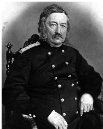
Рис. 5. К.Х. Кнорре в морской форме вице-адмирала