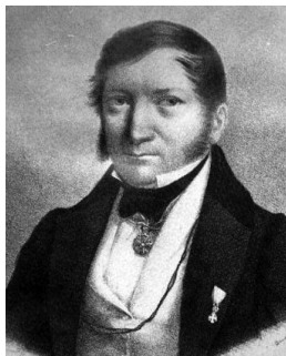
Рис. 1. Молодой В.Струве

В 1816 г. В. Струве начал работу, о которой мечтал будучи студентом университета – тригонометрическую съемку Лифляндии (Эстонии). Дерптский университет разрешил В. Струве использовать для этого летние месяцы. Здесь проявился творческий подход Струве: он разработал новые методы измерения, сконструировал новые оригинальные инструменты. В течение двух с половиной лет он занимался, в основном, проведением съемки. Эта интересная работа явилась для Струве ступенью к более серьезному научному исследованию – измерению дуги меридиана. С 1816 г. по 1818 г. им были проведены полевые измерения и обработка полученных материалов. Из других работ этого периода следует