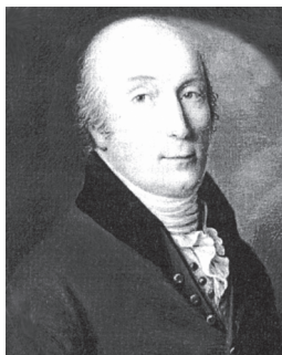
Рис. 2. Эрнст Кнорре