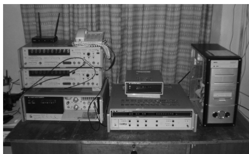
Рис. 2. Рубидиевый стандарт частоты Ч1-74, синхронизатор Ч7-37, счетчики интервалов времени Ф-5041 и компьютер для регистрации данных

В это же время астрономической Службой времени НАО выполнялись регулярные наблюдения в целях определения параметров вращения Земли по программе ВНИИФТРИ на пассажных инструментах типа АПМ-1, АПМ-10, Аскания-Верке, Бамберг, рис. 3. За весь период работы Службы времени было получено около 70 тыс. наблюдений звезд для