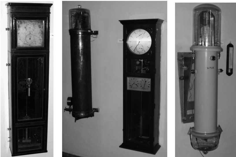
Рис. 1. Часы Hohnu, Shortt, Федченко

Точность маятниковых астрономических часов на протяжении двух столетий составляла от 0.05 до 0.001 доли секунды за сутки. Борьба за точность шла по пути исключения температурных воздействий, для чего часы устанавливались в подвальных помещениях обсерватории, где на протяжении года сохранялась постоянная температура на уровне +12°C. Кроме того, в часах XIX века применялась термокомпенсация длины маятника из соответствующего материала. Постоянно совершенствовалась