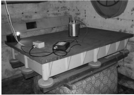
Рис. 5. Сейсмограф Института геофизики НАНУ, установлен в подвальном помещении НАО

ляется применение часов Ф.М. Федченко в сейсмических исследованиях. Ф.М. Федченко закончил основную работу над часами своей конструкции к тому времени, когда появились кварцевые, а в последующем благодаря открытиям в новейшей физике и квантово-механические (или атомные) часы, точность которых на несколько порядков была выше. Казалось, что эра механиче-